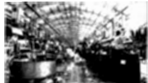
Biancogres vai expandir sua operação no município

09.NOVEMBRO Centro de Convenções de Vitória Credenciamento: 13h30