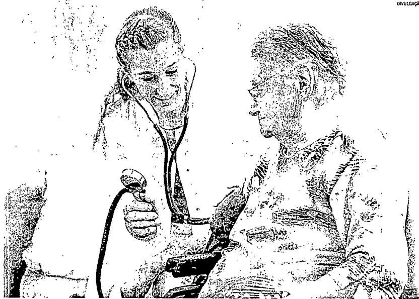
MÉDICA EM ATENDIMENTO: há chances, nas prefeituras de Ibirapu e Serra, para diversas especialidades médicas

é o valor do auxílio-alimentação na Prefeitura da Serra