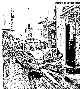
COLISÃO quebrou vidro de prédio

O acidente aconteceu às 9 horas de ontem. O idoso foi levado para o departamento de saúde do local. Seu estado de saúde é estável.