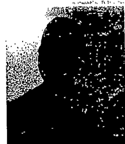
PEDAGOGA assaltada na Serra

O menor foi levado à 3ª Delegacia Regional da Serra e autuado por roubo. O quarto ladrão não foi mais visto.