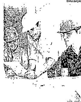
Envolvimento. 38 oportunidades

Os candidatos também podem inscrever presencialmente na Escola de Aprendizes-Marinhei-