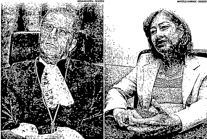
DESEMBARGADORES Carlos Mignone e Catharina Barcellos terão de deixar os cargos após completar 70 anos