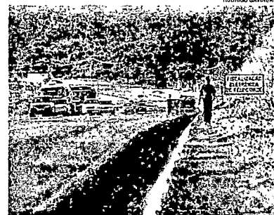
Trabalhadores em Cidade Pomar recebem obras para instalação de postes, mas elas foram paralisadas por falta de autorização da ANTT

Os dois quilômetros de rodovia receberiam 152 postes com luminárias, em um investimento de aproximadamente R$ 300 mil, dos cofres da prefeitura.